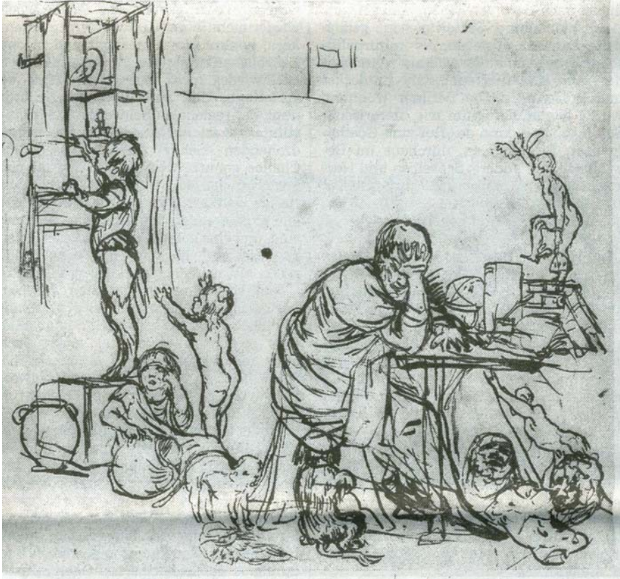
Abb. 1: Adam Elsheimer: Der in Armut Verzweifelte. Federzeichnung, Staatliche Graphische Sammlung München

Wie mühsam sich dieser Ausdruckswille häufig gegen eine Vielzahl irdischer Hemmnisse durchsetzen muss, hat exemplarisch Adam Elsheimer (1587-1610) auf einer mit schnellen, kraftvollen Federstrichen skizzierten Zeichnung dargestellt.