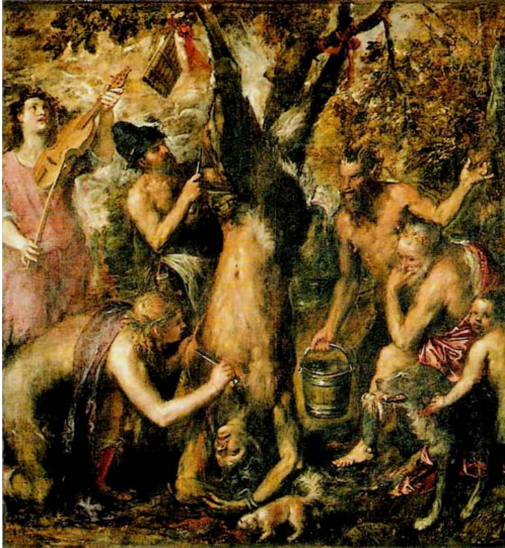
Abb. 5: Tizian: Die Schindung des Marsyas, Öl auf Leinwand, ca. 1570-1576, Kromzíska Tschechische Republik, Museum Kromzíska

Der Flussgott Marsyas wird geschunden – d. h. man zieht ihm bei lebendigem Leib die Haut ab – weil er sich vermessen hat, Apollo zum musikalischen Wettstreit herauszufordern und in diesem Kampf unterlegen ist.