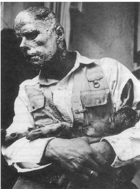
Abb. 4: Joseph Beuys: Wie man dem toten Hasen die Bilder erklärt. Performance zur Eröffnung der Ausstellung: „ ... irgend ein Strang ...“. Düsseldorf, Galerie Schmela, 26. 11. 1965.

Weniger bekannt sind die Parallelerzählungen zur Pygmalionlegende, in denen etwa aus Holz geschnitzte Menschen oder Tiere lebendig werden. Dass sie in den verschiedensten Weltteilen und in Mythen ganz unterschiedlicher Herkunft – von Südamerika bis nach China – auftreten, spricht allerdings eine beredte Sprache. Das magische Weltbild, dem sie entstammen, sollte längst obsolet sein – so zumindest sagt es uns unser Bewusstsein. Die Kunst freilich, dieses atavistische und zugleich zukunftsweisende Zwitterwesen, hat immer auch ihre Verbindungen zum Vergangenen, Anrühigen und Verdrängten unterhalten, mögen diese nun gleichsam verborgen sein unter der Rationalität des Konstrukteurs oder auch provokant herausgestellt werden mit dem Gestus des Magiers und Schamanen, wie ihn Joseph Beuys pflegte.