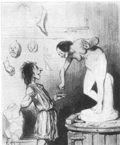
Abb. 3: Honoré Daumier: Pygmalion, Lithographie, 1842

Ein Satiriker von hohen Graden wie Daumier hat diese Entwicklung auf seine ganz eigene karikaturistische Weise interpretiert.