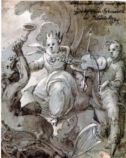
Abb. 6: Stephan Strobel: Das Urteil des Midas, Federzeichnung, um 1605. Nürnberg, Graphische Sammlung des Germanischen Nationalmuseums.

diesen Spruch ungerecht, und zur Strafe ließ Apollo dem König Eselsohren wachsen. Der Nürnberger Maler Stephan Strobel hat um 1605 das „Urteil des Midas“ zum Thema einer schwungvollen barocken Zeichnung gemacht.